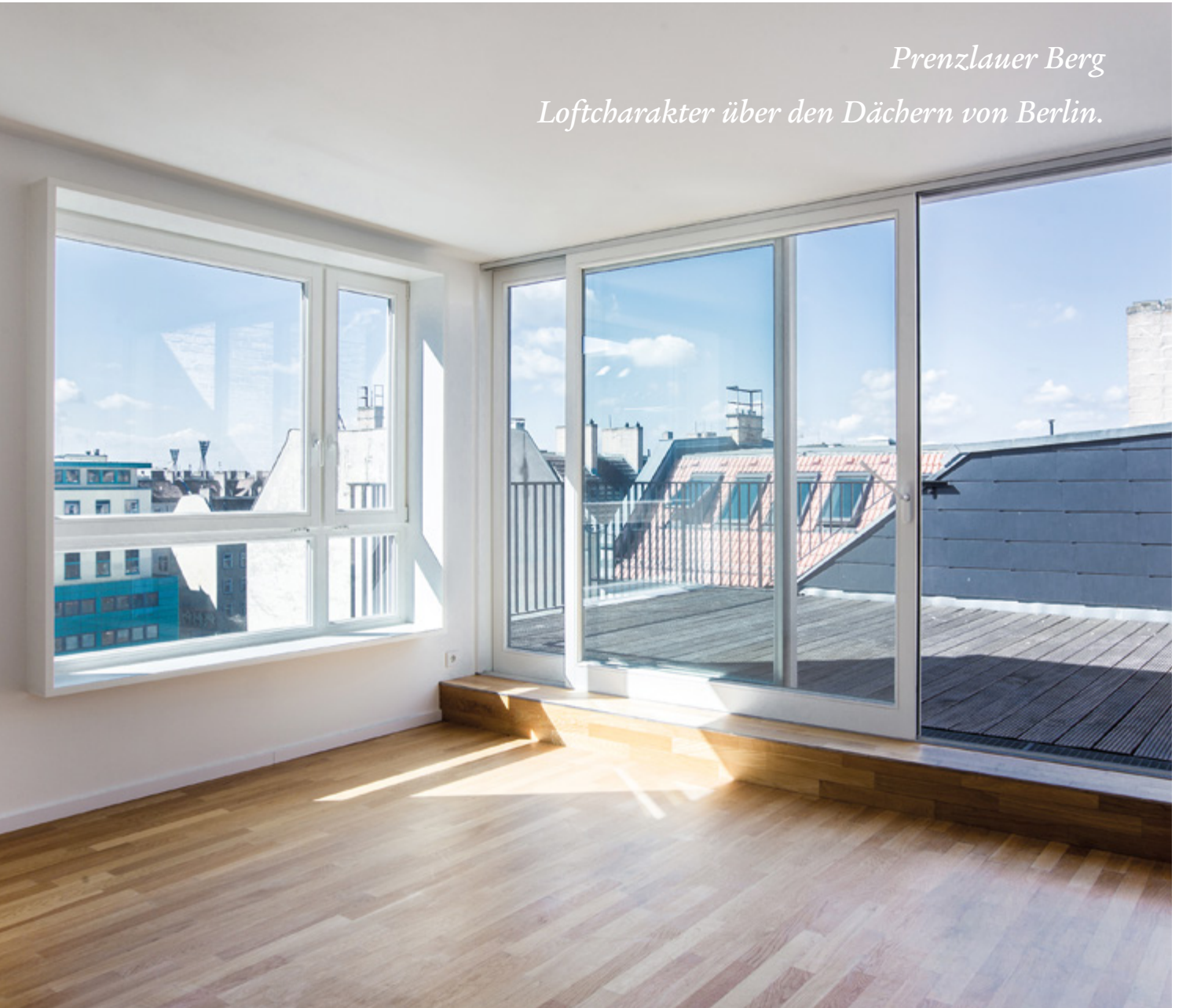
Prenzlauer Berg Loftcharakter über den Dächern von Berlin.

«Moderne Wohnkonzepte ermöglichen die Vereinbarkeit von Wohnen, Arbeit und Freizeit.»